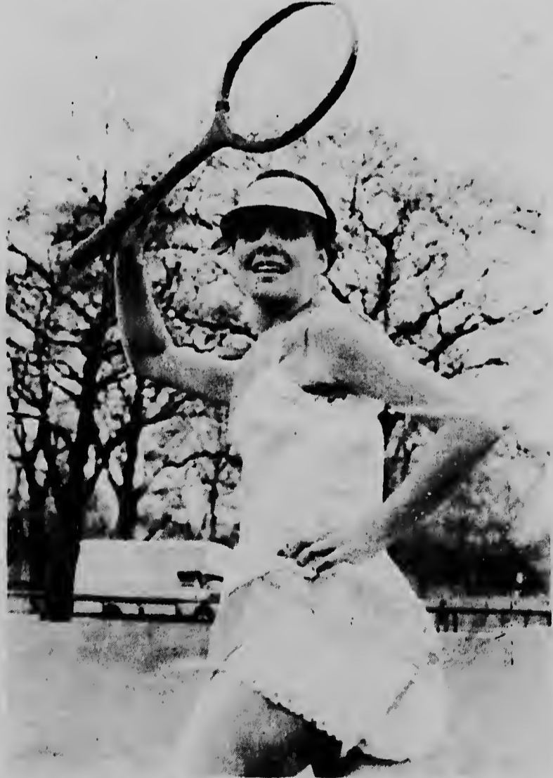
Si tur mucha muher qu ta hunga tennis bisti asina aki, nos tambe ta bai hunga tennis! E diseño aki ta lo ultimo di e diseñador Teddy Tilling, famoso pa su trahenan "a la Mini". E fraña di e shimis ta di loque Teddy ta yama "nylon sunu".